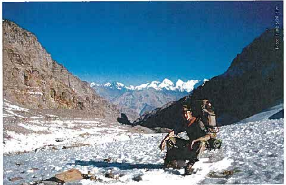
Über Grenzen hinwegsehen und -gehen: Rast am Schitcharw-Pass. Über die schneebedeckten Berge des Hindukusch am Horizont verläuft die Grenze zwischen Afghanistan und Pakistan.

Tatsächlich gab es ein bürokratisches Schlupfloch: Man benötigte ein Transitvisum, das einen für drei